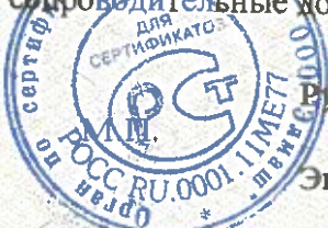
Схема сертификации № 3

Знак соответствия по ГОСТ Р 50460-92 наносится на изделие и на товарно-сопроводительные документы